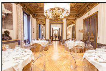
6 rue Galilée, 75116 PARIS

DANS LES SALONS DE L'AÉRO-CLUB DE FRANCE